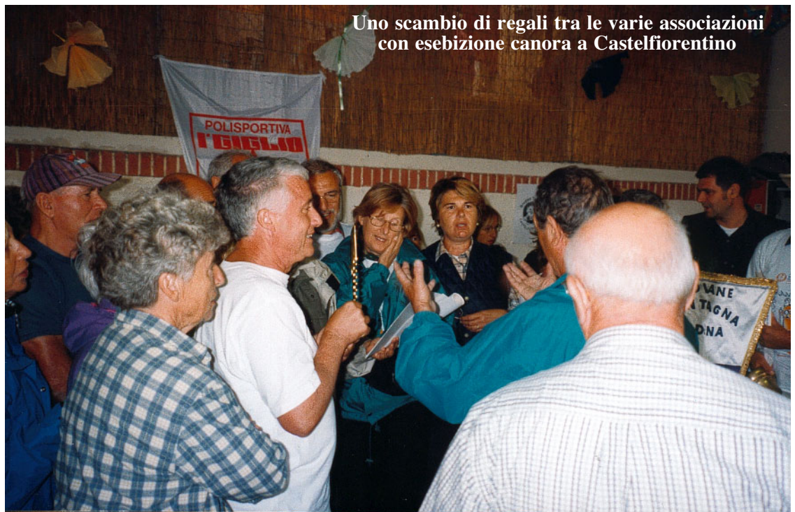
Uno scambio di regali tra le varie associazioni con esibizione canora a Castelfiorentino

Arriviamo così sul bel poggio di Coiano, uno dei centri più conosciuti della Val d'Elsa, rinomato dalla presenza