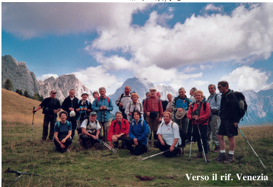
Verso il rif. Venezia

Condividere con gli amici di Modena quest'esperienza fortifica in noi gli ideali della Giovane Montagna. Ideali forti, fatti di fede, di gioia, di speranza e di amore.