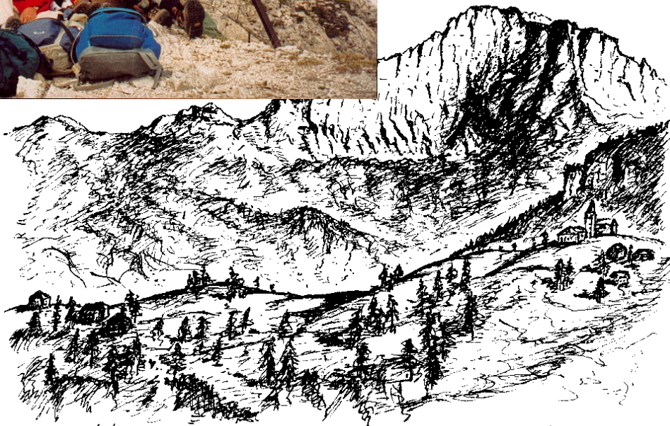
LASTE - 6/9/2003

Quante montagne hanno beatificato i nostri occhi: la bastionata del Civetta, sempre in continua metamorfosi; il Pelmo con la sua mole inconfondibile; la Marmolada dalle sue multiformi pose; e ancora, il Sella, il Sassolungo e un'infinita varietà di cime che non si possono nè contare, nè conoscere. Ma che resteranno impresse nella memoria dei ricordi come un qualcosa che ci allietta e ci fa vivere.