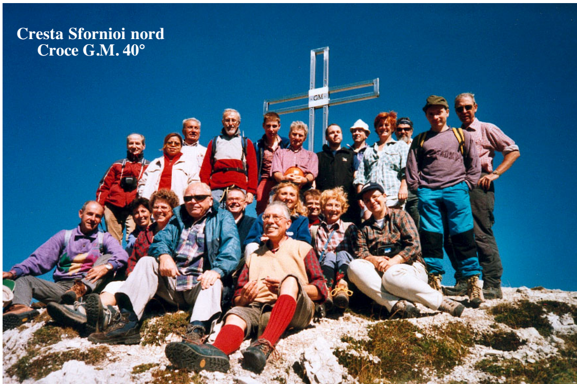
Cresta Sforioi nord Croce G.M. 40°

Ma noi dobbiamo salire ancora per una via ormai quasi priva di copertura erbosa, verso la croce posta dalla Giovane Montagna per il suo quarantesimo. Dopo una mezz'oretta, salendo in mezzo a sassi di tutte le dimensioni, ma abbastanza stabili, raggiungiamo la croce dove ci rifocilliamo e facciamo le solite foto ricordo.